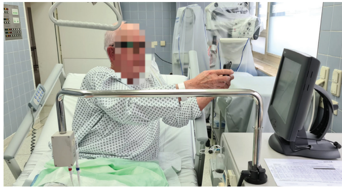
פציינט במהלך טיפול מתעד את מסך מכשיר הסינרגו

***המידע בכתבה אינו מהווה המלצה רפואית מוסמכת והוא לא נועד להנחות את הציבור או לשמש כעצה רפואית, וכן אין לראות בו תחליף ליעוץ רפואי פרטני או אחר, המתאים לנתוניו וצרכיו של כל אדם.